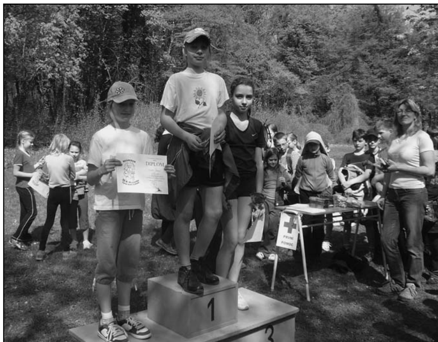
Na stupních vítězů