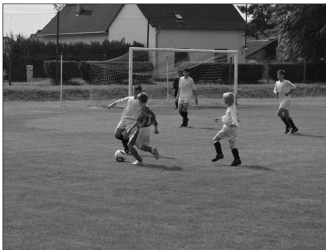
Záběr ze žákovského turnaje Memoriál O. Zdeňka.