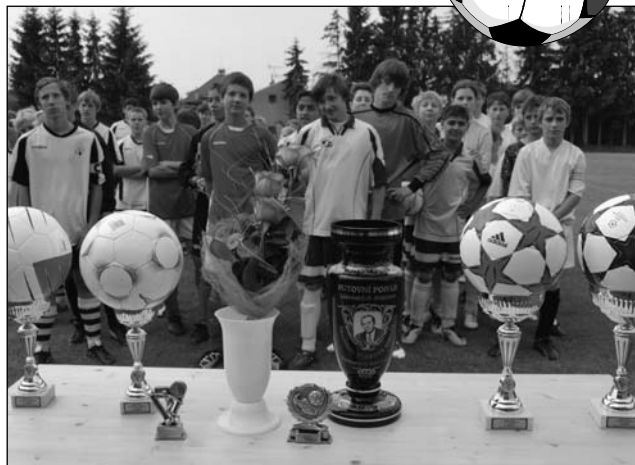
Poháry pro vítěze

ním duchu za celkem pěkného počasí. Hoši bojovali, bylo vidět, že se chtějí všichni stát majiteli putovního poháru. Povzbudit naše žáčky přišli někteří rodiče a příznivci kopané, za což jim patří dík.