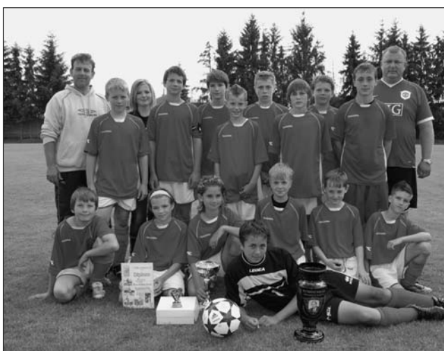
Naše vítězné mužstvo

Vyhodnocení provedla paní starostka, odměnou všem mužstvům byl diplom, pohár, fotbalový míč a sladká tečka na závěr v podobě rolády. Věřím, že se žákovský turnaj vydařil ke spokojenosti všech a těším se