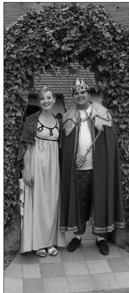
Král a královna