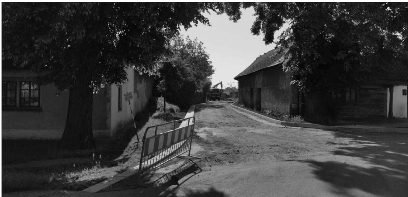
Rekonstruovaná ulice V Glančici